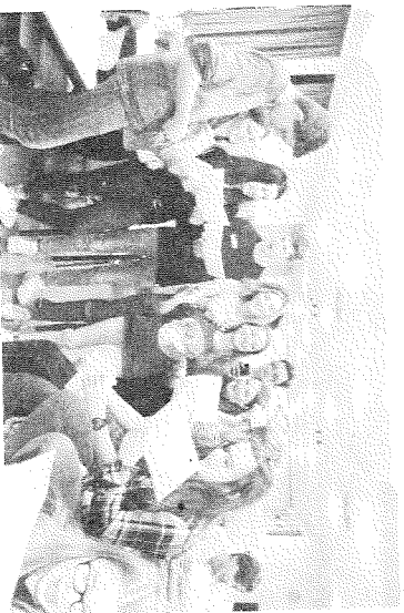
„Biene Majar“ im Wechsel auf Deutsch und Tschechisch – buntes Programm beim Ehemaligen-Abend

auch eine Tour durch den Moldau-Hafen gab, der tatsächlich tschechisches Staatsgebiet ist. Außerdem haben wir uns in Lauenburg an der Elbe im dortigen Schifffahrtsmuseum vornehmlich mit dem Fluss beschäftigt, der die beiden Länder verbindet. Und der obligatorische Besuch im Herde-Park, der besonders den tschechischen Jugendlichen immer besonders viel Spaß macht, durfte natürlich nicht fehlen.