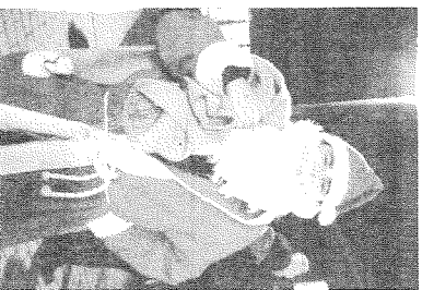
Der total echte Weihnachtsmann