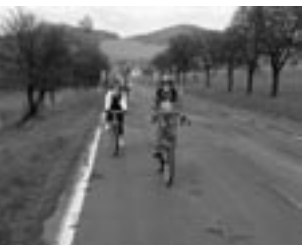
Verbindung erfahren – 10. Jahrgang der gemeinsamen deutsch-tschechischen Pfadfinderradtour