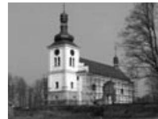
Skt. Martinskirche in Markvartice