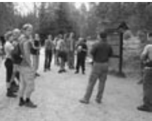
Umweltschutz in den Nationalparks Böhmerwald und Bayerischer Wald