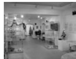
Výstava Skleněné Vánoce