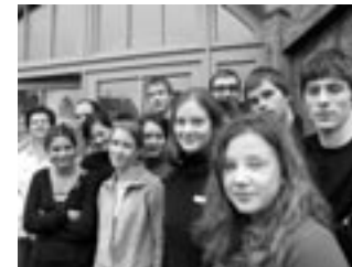
Projekt Demokracie a média

K finančně nejvýrazněji dotovaným projektům patří stejně jako v minulosti roční studijní pobyty středoškoláků , jejichž počet se již několik let pohybuje kolem 100 uchazečů ročně, a projekt odborných praxí pro středoškoláky a učně , organizovaný Koordinačním centrem česko-německých výměn mládeže Tandem. V roce 2006 bylo na tyto projekty vyčleněno téměř 6 mil. Kč. V rámci těchto dlouhodobých pobytů dochází u mladých lidí k hlubšímu poznání životních podmínek v sousední zemi a tím k reálnější představě o budoucí česko-německé spolupráci. Mnozí z bývalých účastníků těchto výměnných pobytů