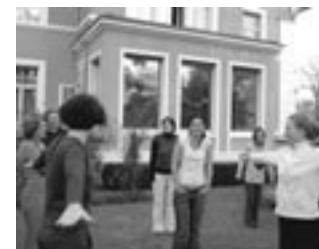
Seminář pro vedoucí mládeže na téma: Interkulturní učení v česko-německém kontextu