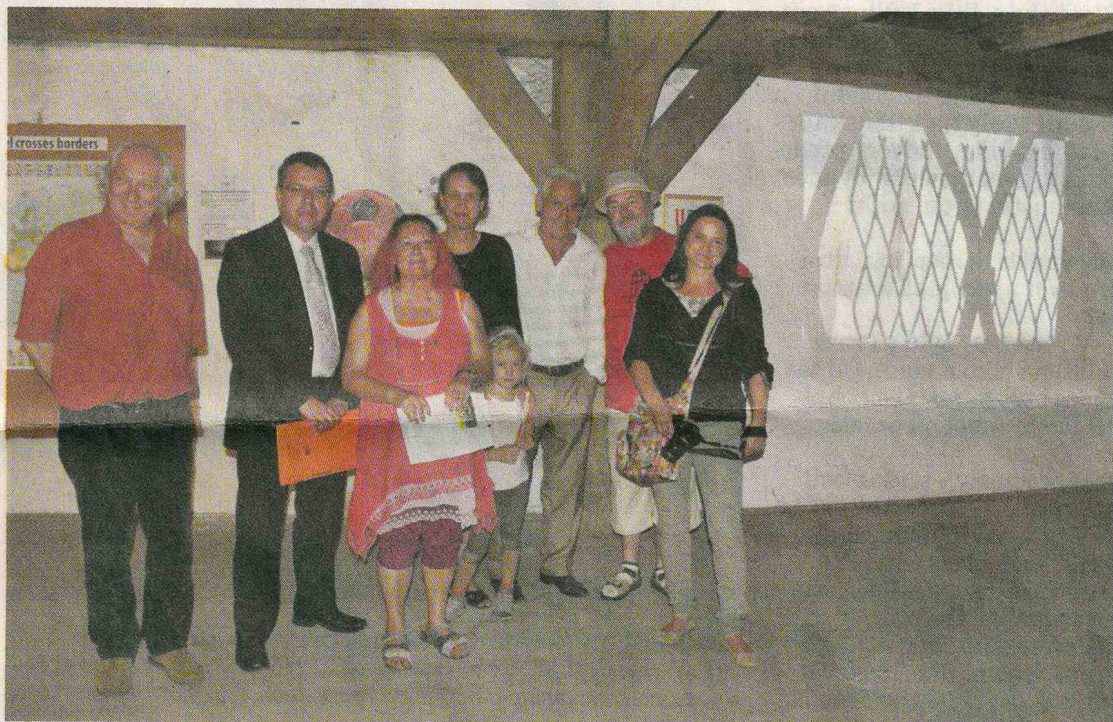
POPRVÉ MOHLI lidé díla spatřit na výstavě na Chebských dvorcích, které se zúčastnili také někteří autoři. Diváci zhlédli rovněž film, který se na slavnostním zahájení promítal.

První část projektu se konala už v dubnu, kdy se v Chebu setkala devět umělců – tři z Bavorska, tři ze Saska a tři z Česka. „Byli zde zastoupeni malíři, grafici, fotografové, kteří vytvořili smíšené pracovní skupiny, ve kterých nejprve prezentovali svoji volnou tvorbu, ať už současnou nebo tvorbu, která vznikala před pádem 'železné opony',“ doplnil ředitel Illek. „Každý z autorů také