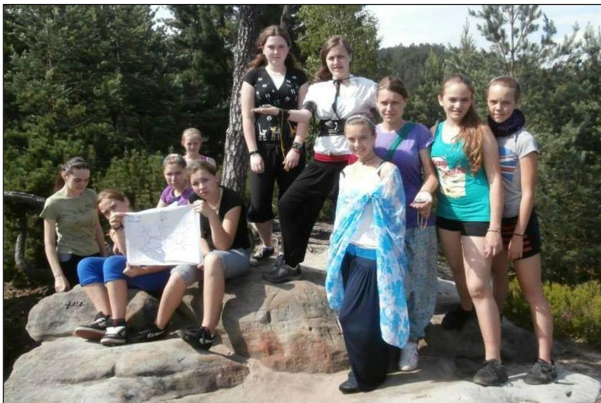
Výprava pro mapu Alamútu

Pozn. red.: Holky ode mě dostávají obrovskou pochvalu za originálně napsaný článek!