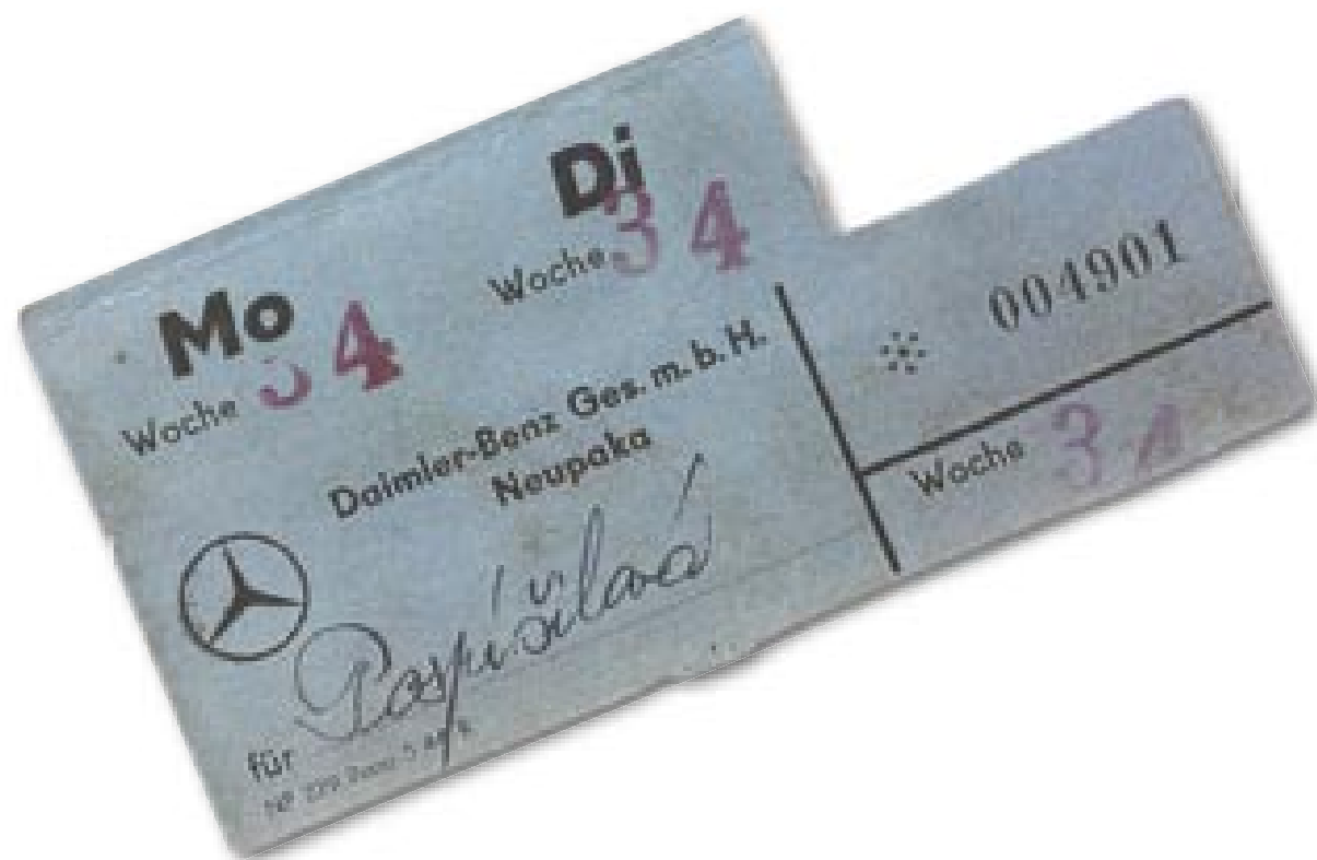
Stravenky pro zaměstnance firmy Daimler-Benz v Nové Pace Essenkarton für die Arbeiter bei Daimler-Benz in Neupaka