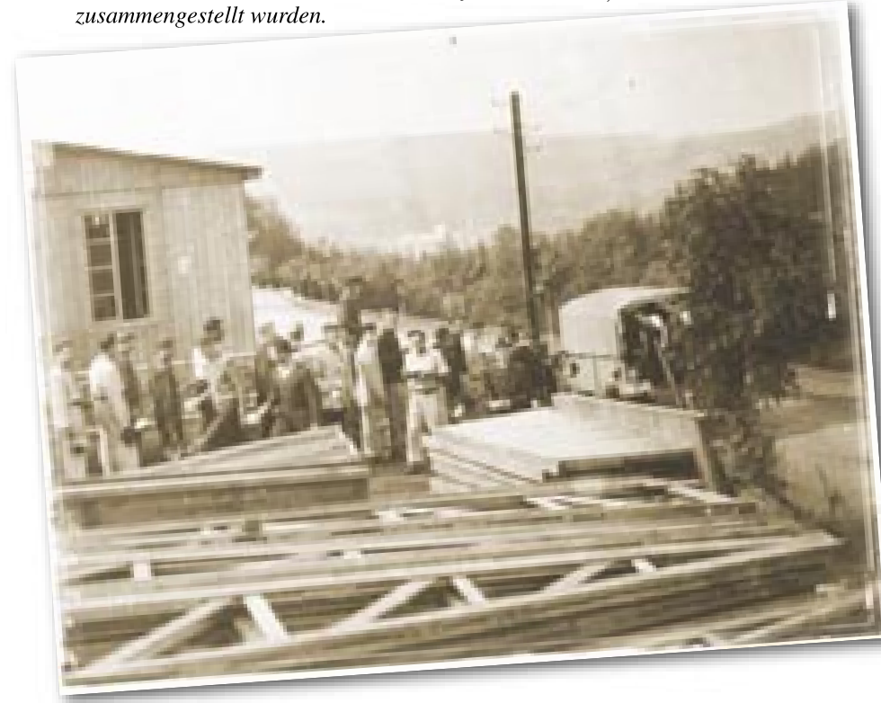
Lagerbau in Semil. Den Arbeitern der Technischen Nothilfe wird gerade das Essen verteilt. Bemerkenswert sind die Holzkonstruktionen, aus denen die Baracken zusammengestellt wurden.