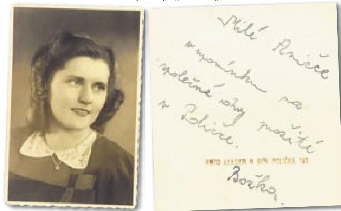
Fotografie mit der Widmung einer Mitarbeiterin aus dem Betrieb in Politschka. Die Freundschaft half die schweren Arbeits- und Unterkunftsbedingungen zu ertragen