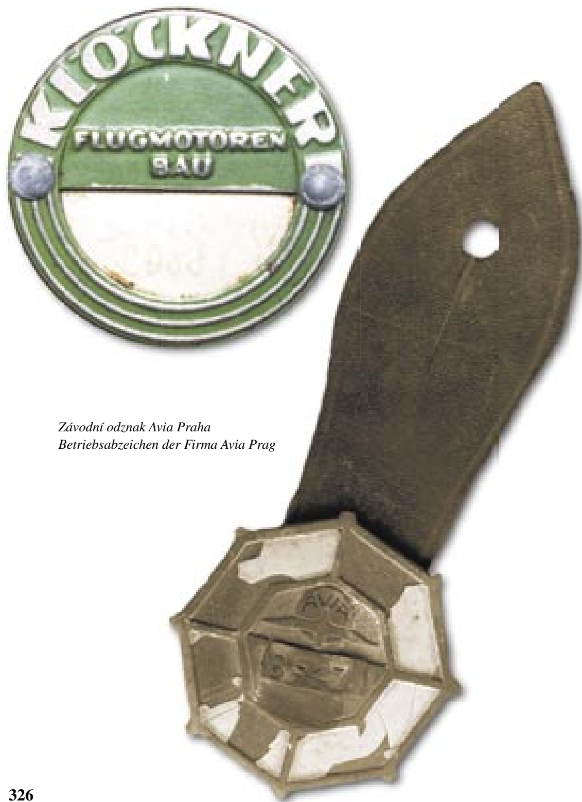
Závodní odznak Avia Praha Betriebsabzeichen der Firma Avia Prag