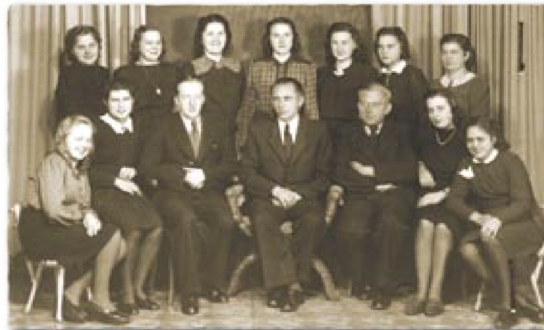
Fotografie s věnováním spolupracovnice z muničního závodu v Poličce. Přátelství pomáhalo vydržet těžké pracovní i ubytovací podmínky