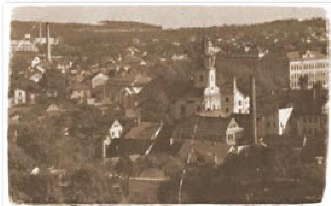
Ubytovny pro nuceně nasazené dělníky firmy Daimler-Benz v Nové Pace Wohnlager für die Zwangsarbeiter der Firma Daimler-Benz in Neupaka