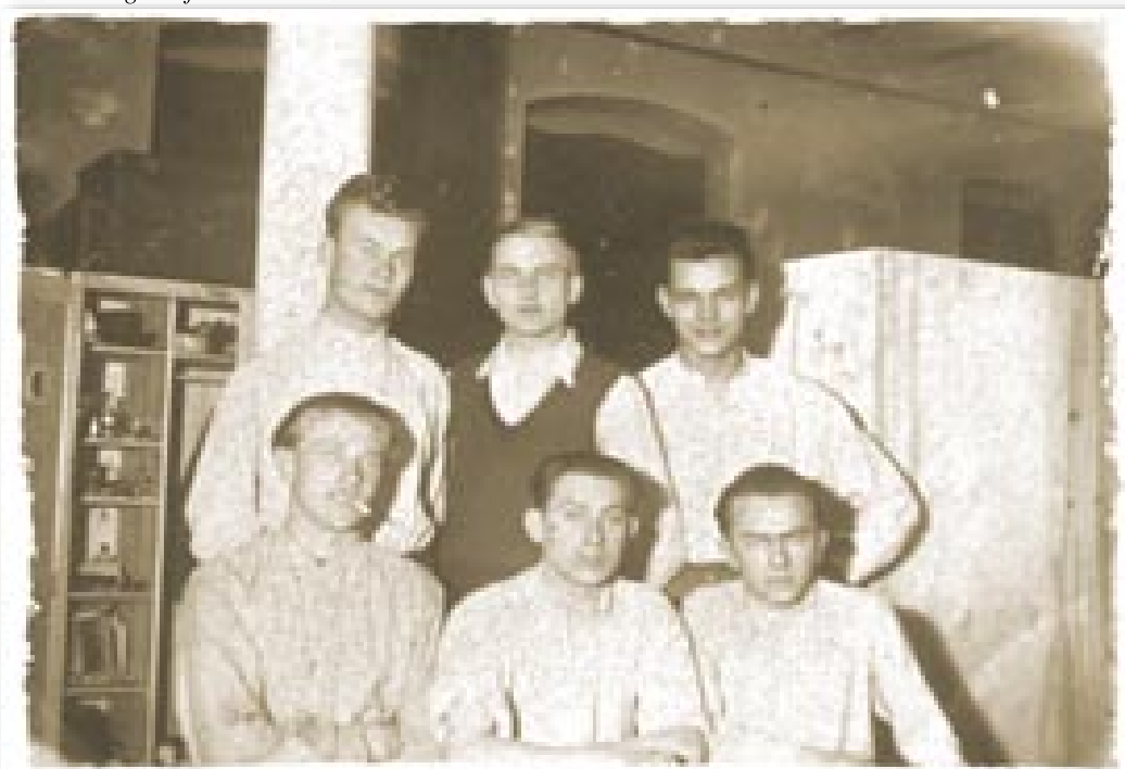
Dřevěný lágr pro dělníky z „Junkersky“ ve Dvoře Králové na Labem Holzlager für die Arbeiter bei Junkers in Königinhof an der Elbe