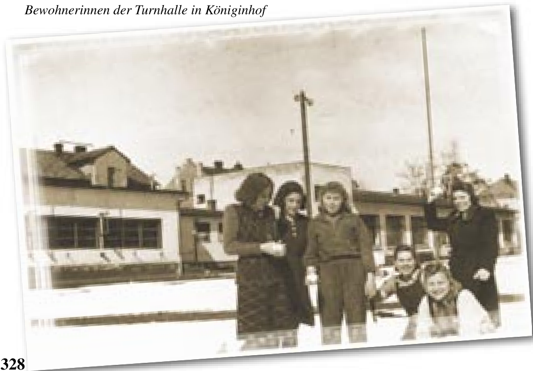
Obyvatelky sokolovny ve Dvoře Králové Bewohnerinnen der Turnhalle in Königinhof