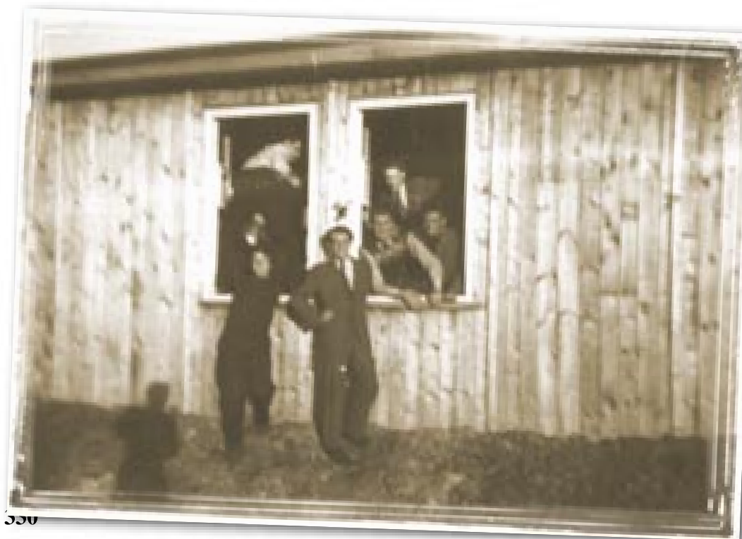
Dřevěný lágr pro dělníky z „Junkersky“ ve Dvoře Králové na Labem Holzlager für die Arbeiter bei Junkers in Königinhof an der Elbe