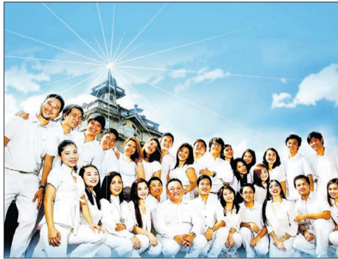
Die „University of Santo Tomas Singers“ inszenieren ihr Programm mit bunten Gewändern, Tänzen und szenischen Darstellungen.

Die Konzerte bieten musikalische Vielfalt: Auf klassische Werke aus fünf Jahrhunderten folgen Gospel, Pop, Musical, Traditionals, philippinische Folklore und Experimentelles.