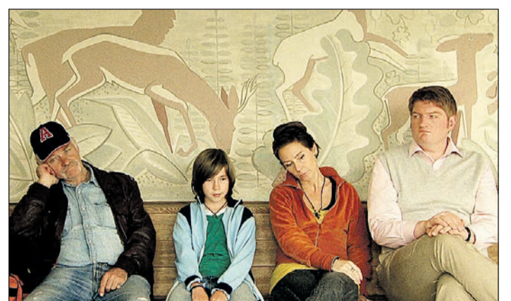
Sohnemänner: Ein nachlässiger Vater und sein schuldgebewusster Sohn zanken um die richtige Pflege der Oma, deren Wohl auf der Strecke bleibt.

Nicht einheimisch, aber dennoch in der deutschen Fassung zu sehen ist die Klassiker-Entdeckung „Das Kuckucksei“ (5. Mai, 21 Uhr). Diese Tragikomödie aus den 1980ern basiert auf den gleichnamigen Broadway-Hit. Im Kurzfilmprogramm zeigt „Heartbreaker“ (8. Mai, 21 Uhr) vom Freiburger Schauspieler und Regisseur Martin Mayer, was einem so alles auf einer verträumten Straße in