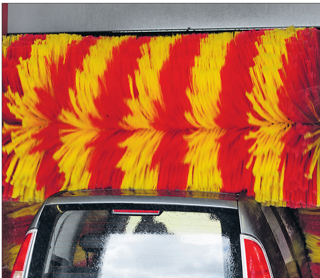
Die Autowäsche nach dem Winter beseitigt den Winterschmutz.

■ Der Motorraum: Die Technik hat unter der strengen Witterung gelitten. Bei modernen Fahrzeugen dennoch nicht gleich zum Dampfstrahl-