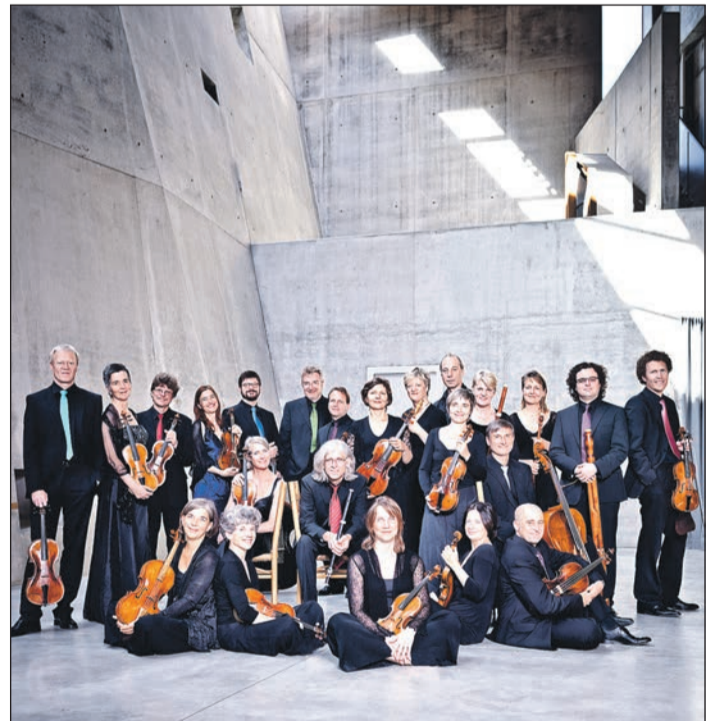
Mit Bachs Brandenburgischen Konzerten eröffnete das Freiburger Barockorchester seine erste Saison – am Montag erklingt der Zyklus erneut.

Aus Anlass seines 25-jährigen Bestehens bringt das Freiburger Barockorchester Bachs konzertante Visitenkarte für Orchester erneut als gesamten Zyklus auf die Bühne des Konzerthauses. Anschließend werden die Werke für das Label harmonia mundi France im Ensemblehaus auf CD aufgenommen.