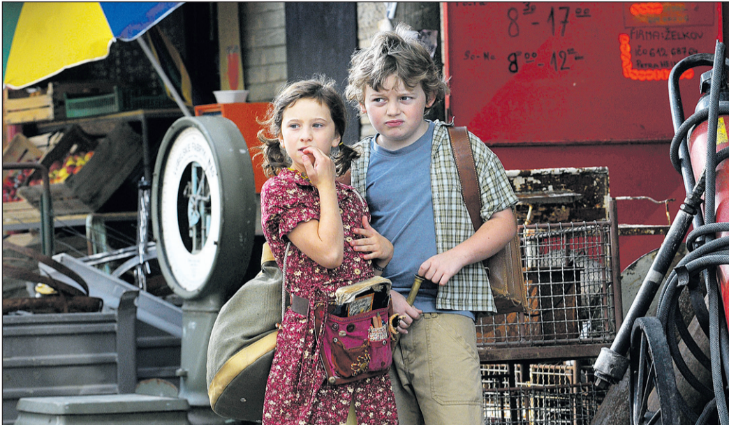
Ein humorvoller Familienfilm voll Abenteuer und Magie: „Der blaue Tiger“ entführt in die Welt der Fantasie – empfohlen für Kinder ab 8 Jahren.

Die Ausstellung in der Stadtbibliothek Freiburg vom 14. Mai bis 16.