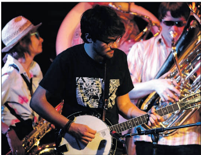
Das gemeinsame Ensemble, die Funky Marching Band.