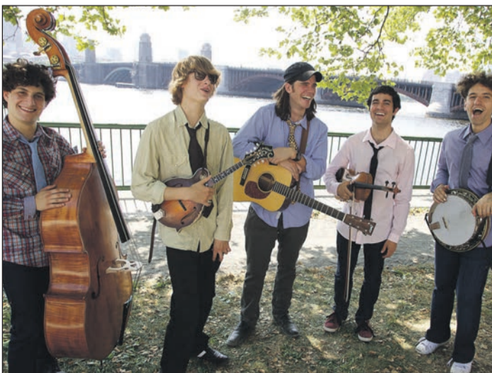
Die Deadly Gentlemen vor der Longfellow oder West Boston Bridge in Boston, Massachusetts, USA.

Mit den Deadly Gentlemen kommen fünf junge amerikanische Bluegrass Musiker aus Boston mit einem akustischen Experiment daher: gepappte Vokalsätze, punktiert und mit derber Lyrik versehen, eingebettet in instrumentale Eruptionen, die ohne Scheu den alten Instrumenten alles abverlangen und die Bluegrass-Scheune zum Beben bringen. Mit viel Humor und Leidenschaft brechen sie mit den Konventionen des Genres, mischen unverblümt Rap Elemente mit Jazz und Acoustic-Rock und kehren dennoch immer wieder bei Newgrass und Bluegrass ein, um zu zeigen, wo alles begann.