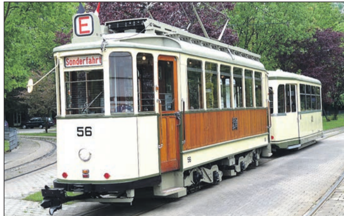
Ein besonderes Erlebnis: Eine Fahrt durch Freiburg mit der historischen Straßenbahn.

Die Fahrzeuge der Oldtimerlinie 7 sind ab 9.58 Uhr auf Schiene, das Tramcafé lädt ab 12.29 Uhr zum Be-