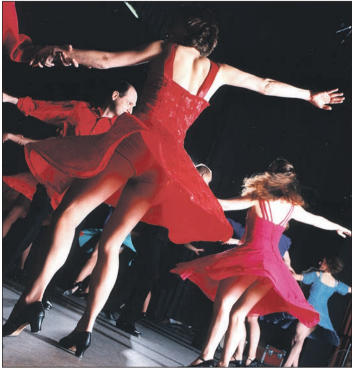
„Follies“ lautet der Titel der Jubiläumsshow zum 25-jährigen Bestehen der Musical-TAP-Company.

Musical-TAP-Company lädt zum 25-jährigen