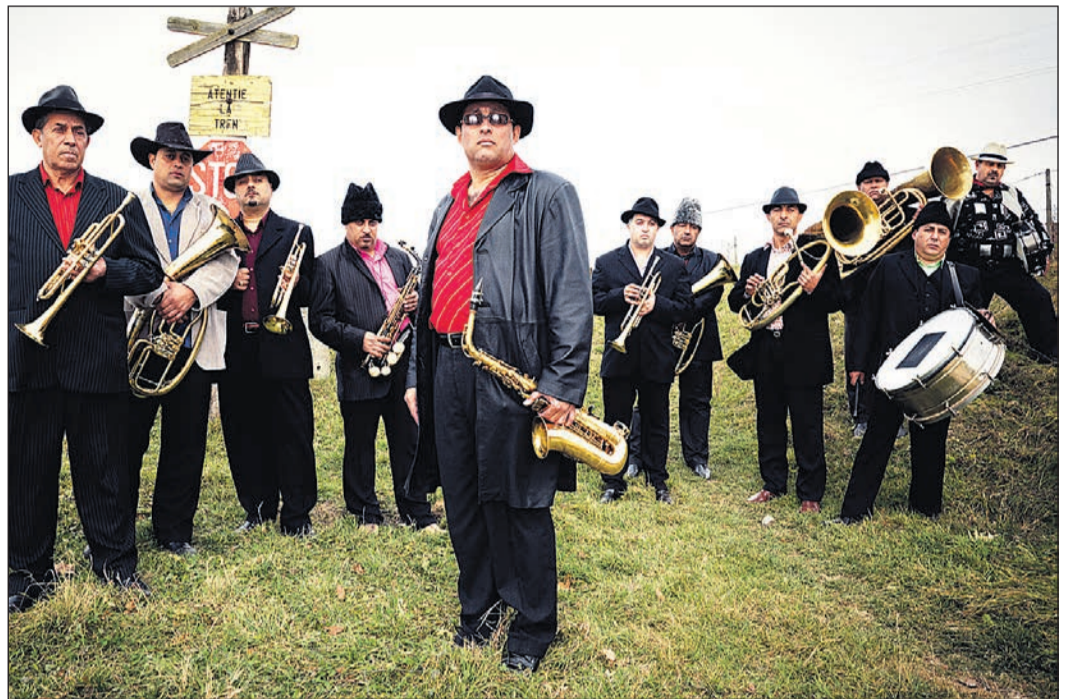
Von der Dorfkapelle zu Filmstars: Die Roma-Musiker der Fanfare Ciocărlia.

Weitere Informationen zur Band und zum Kartenvorverkauf finden sich im Internet unter www.ewerk-freiburg.de .