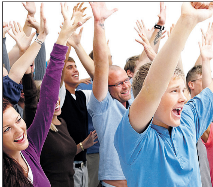
Am Sonntag wird gemeinsam gelacht.