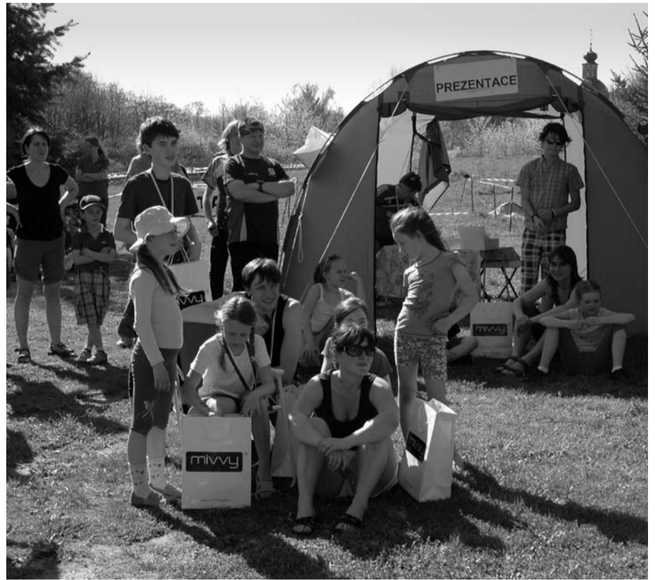
Na 250 účastníků se sjelo poslední dubnovou sobotu do Sportkempu na závody v orientačním běhu, pořádané kralovickým oddílem Kometa.

(Viz též příspěvek „Informace ke sběru bioodpadu“ na této straně.)