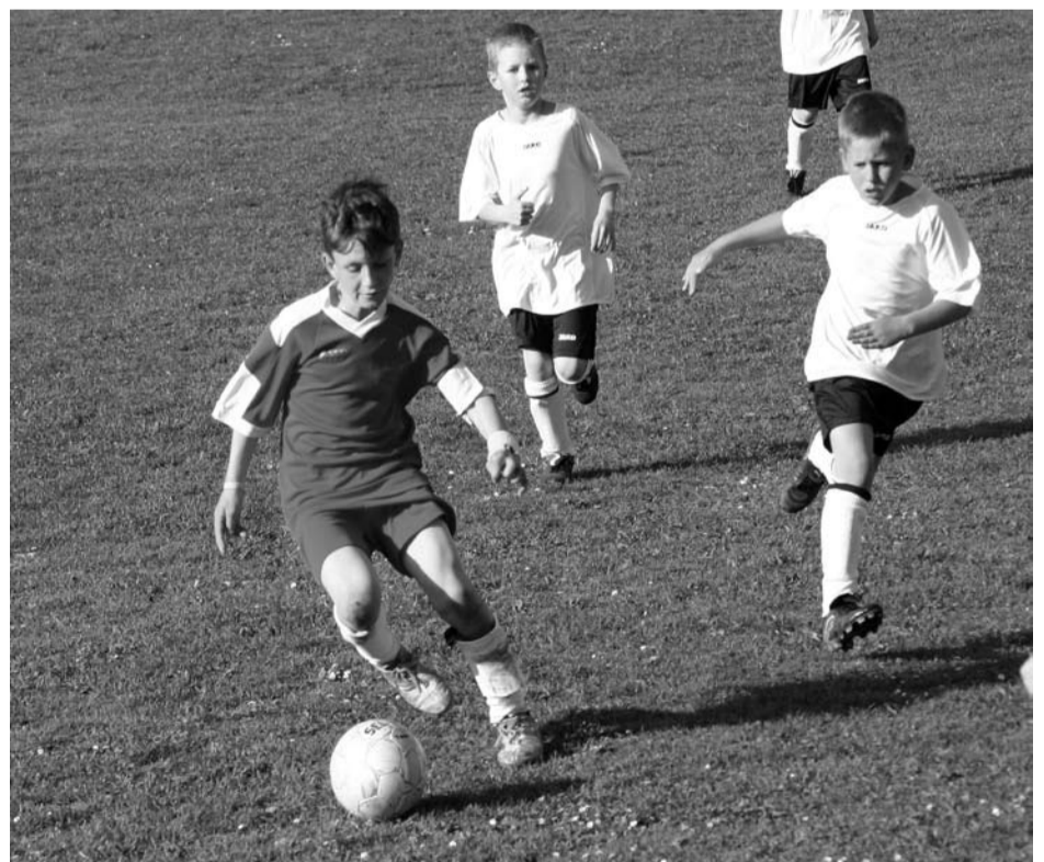
V utkání okresního přeboru přípravek podlehl kralovický potěr (v bílém) na Hadačce domácímu celku 3:4.

Sportovní zpravodajství připravuje Karel POPEL