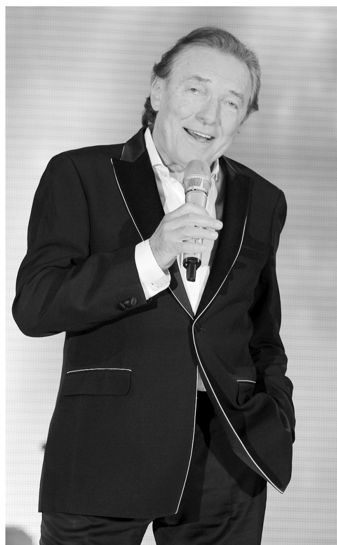
Karel Gott ve středu koncertoval v ČEZ Areně Plzeň. Během svého vystoupení zpíval české a světové evergreeny.